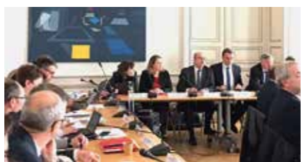
Intervention de François Lions, membre du collège de l'Arcep, à la CRSN Pays de la Loire en février 2020 (avant la crise sanitaire).