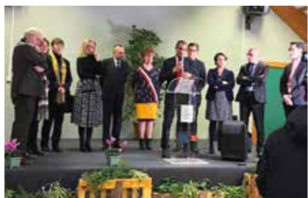
Participation d'Emmanuel Gabla, membre du collège de l'Arcep, à l'inauguration en Normandie d'un site du dispositif de couverture ciblée, en janvier 2020 (avant la crise sanitaire).

Revivez l'édition 2021 de la conférence « Territoires connectés » également disponible en ligne.