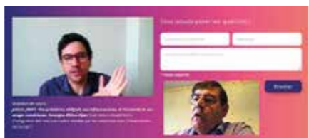
« Tchat » vidéo en direct du 10 avril 2020, avec Sébastien Soriano, alors président de l'Arcep, et son invité Patrick Chaize, sénateur de l'Ain et président de l'Avicca, pour répondre aux questions des collectivités.

Pour prolonger cet échange, l'espace dédié aux collectivités sur le site de l'Arcep met à disposition supports de présentation, travaux et outils indispensables à l'aménagement numérique de leur territoire.