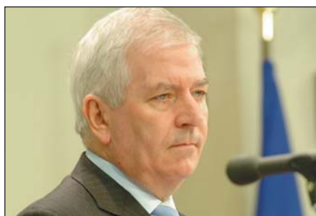
Charlie McCreevy, Commissaire européen en charge du marché intérieur

des marchés postaux à la concurrence à l'horizon 2009. Cette date figurait dans la directive de 2002, complétée